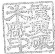
Stamp of exporter

茲證明本證明僅對所送樣品負責, 同批產品發証證明為 6 個月書內所列之貨品原產地為台灣, 本證明書將建檔保存二年。